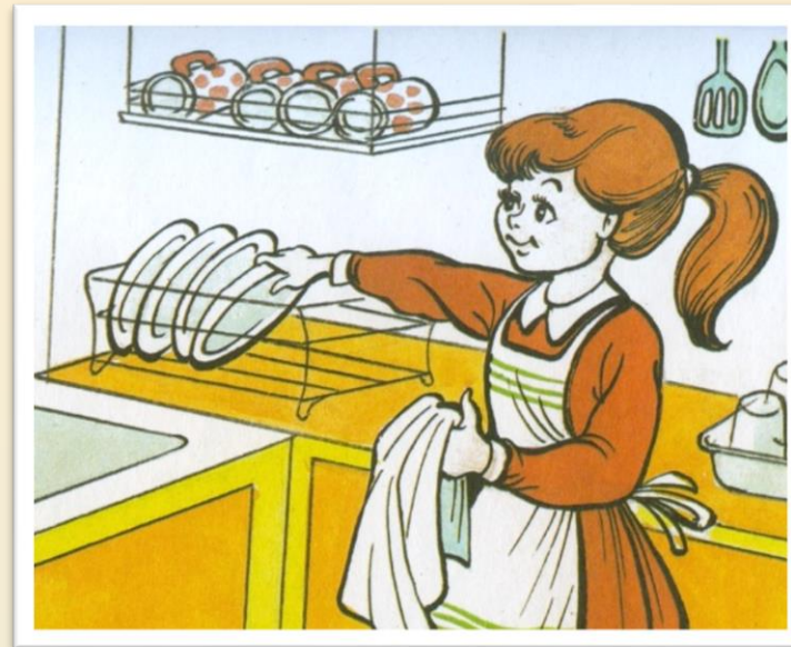
Маша моет посуду