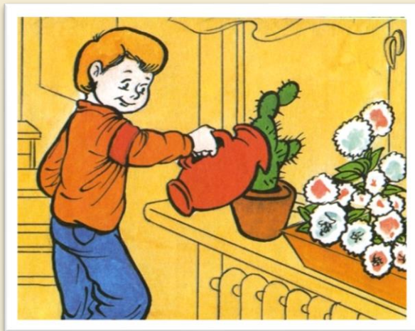
Вова поливает цветы